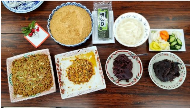
大根おろし・納豆・あんこ・きな粉・ゆずねぎ