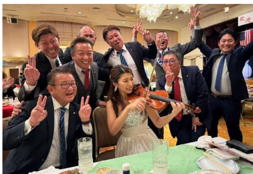
参加された皆様、お疲れ様でした。