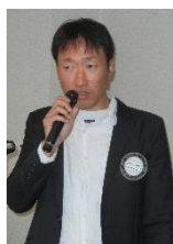
新沢親睦活動 委員会委員長 開会のご挨拶