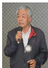
林会員 による 乾杯