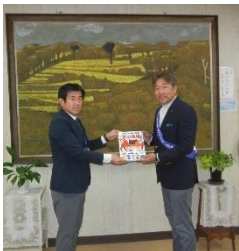
長柄町 長柄小学校