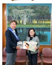
長柄町 日吉小学校