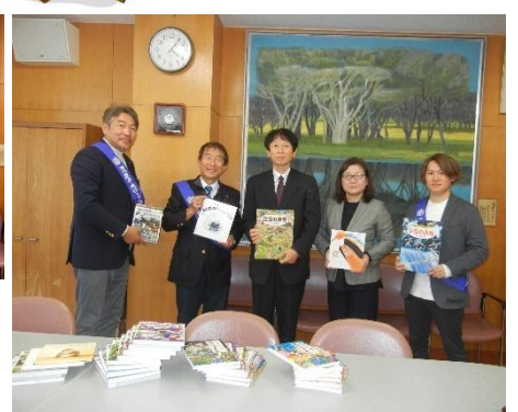
贈呈図書の一部です