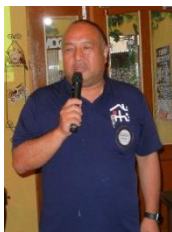
飛留間幹事 による乾杯