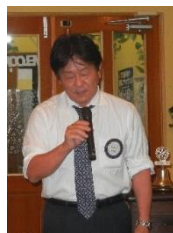
片岡会員による 締めのご挨拶