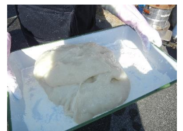
さあ～、お餅がつきあがりました。