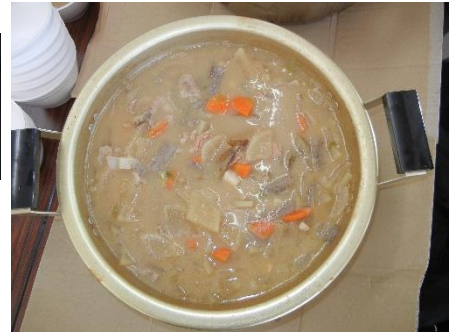
大根おろし・納豆・あんこ・きな粉・ゆずねぎ