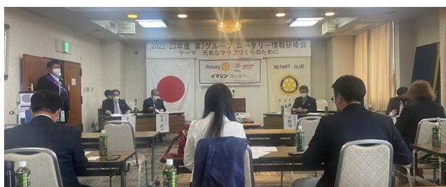
参加された皆様お疲れ様でした。