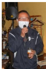
今井会員 による乾杯