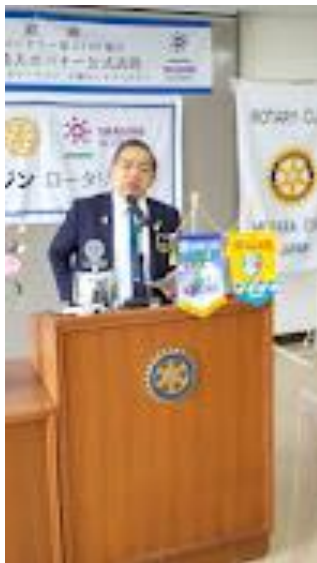
小倉ガバナー による講評