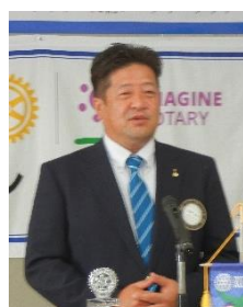
茂原中央 RC 発表