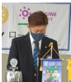
茂原中央 RC 会長