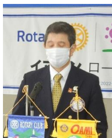
大網 RC 会長