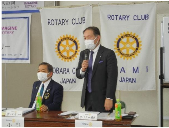
平野ガバナー補佐