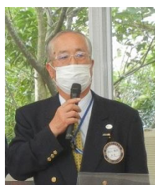
大網 RC 発表